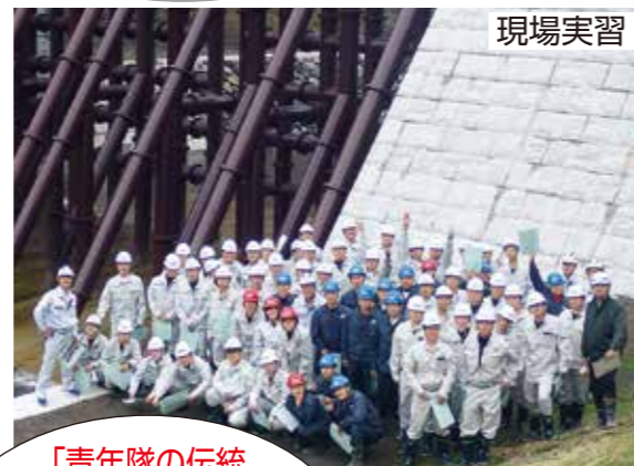
「青年隊の伝統+民間のスキル」で、より充実した教育システムを構築! 伝統を繋ぐ修了生は約5000人!