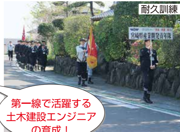
第一線で活躍する土木建設エンジニアの育成!