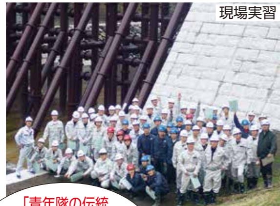
「青年隊の伝統+民間のスキル」で、より充実した教育システムを構築! 伝統を繋ぐ修了生は約5000人!