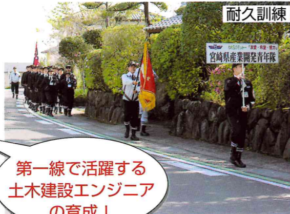
耐久訓練 第一線で活躍する土木建設エンジニアの育成!